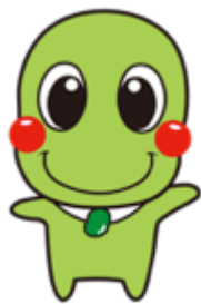
提供予定のグリーンピース所属ゆるキャラ「そらまめくん」